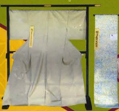
きものと帯コンテスト 2016年度大賞作品

丹誠込めて紡がれた 西陣の新作きものと 帯が勢揃い。 皆様の投票によって 経済産業大臣賞ほか 各賞が決定されます。